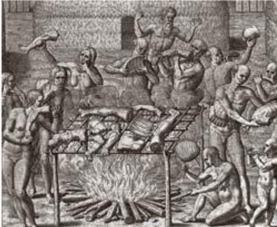
Tupinambás em ritual de antropofagia retratado por Théodore de Bry: Montaigne desafia o senso comum.