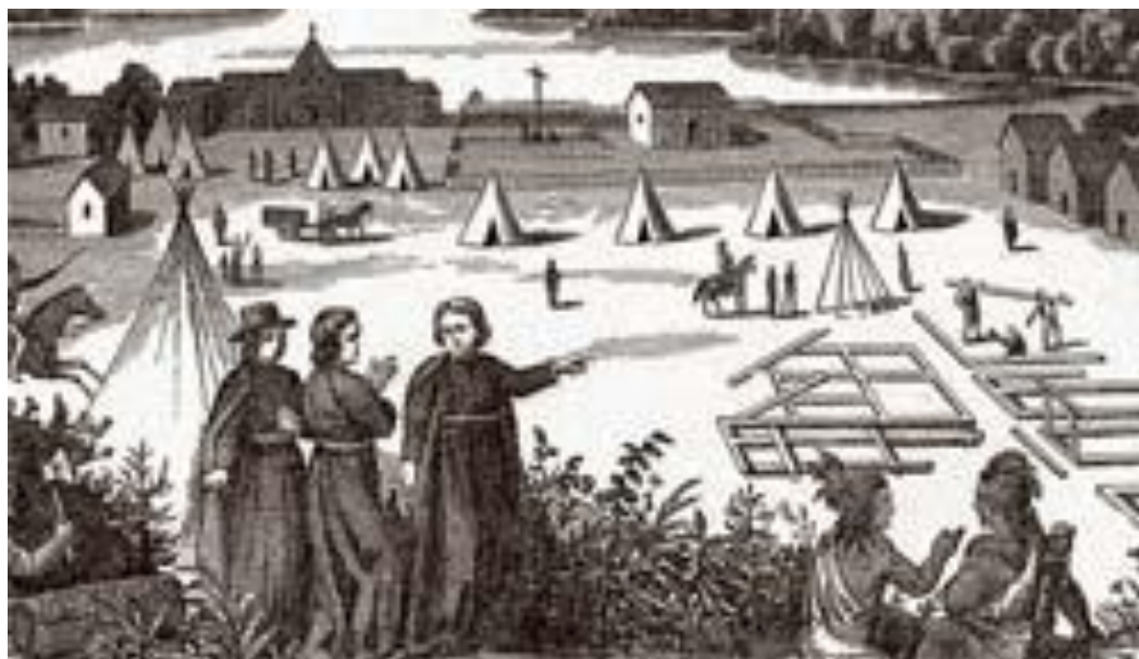
Missionários jesuítas entre índios americanos: europeus catequizam os nativos.