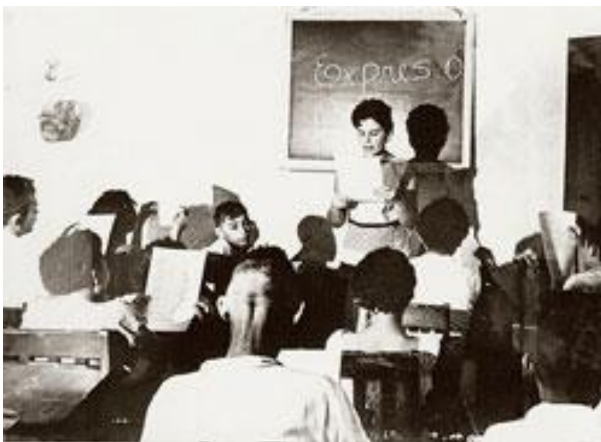
Aula em Angicos, em 1963: 300 pessoas alfabetizadas pelo método Paulo Freire em um mês.

O ambiente político-cultural em que Paulo Freire elaborou suas ideias e começou a experimentá-las na prática foi o mesmo que formou outros intelectuais de primeira linha, como o economista Celso Furtado e o antropólogo Darcy Ribeiro (1922-1997).