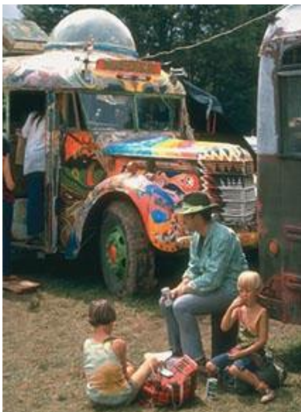
Hippies norte-americanos dos anos 1960: contracultura adotou as ideias de Rogers.

Teoria adequada a um tempo de contestação