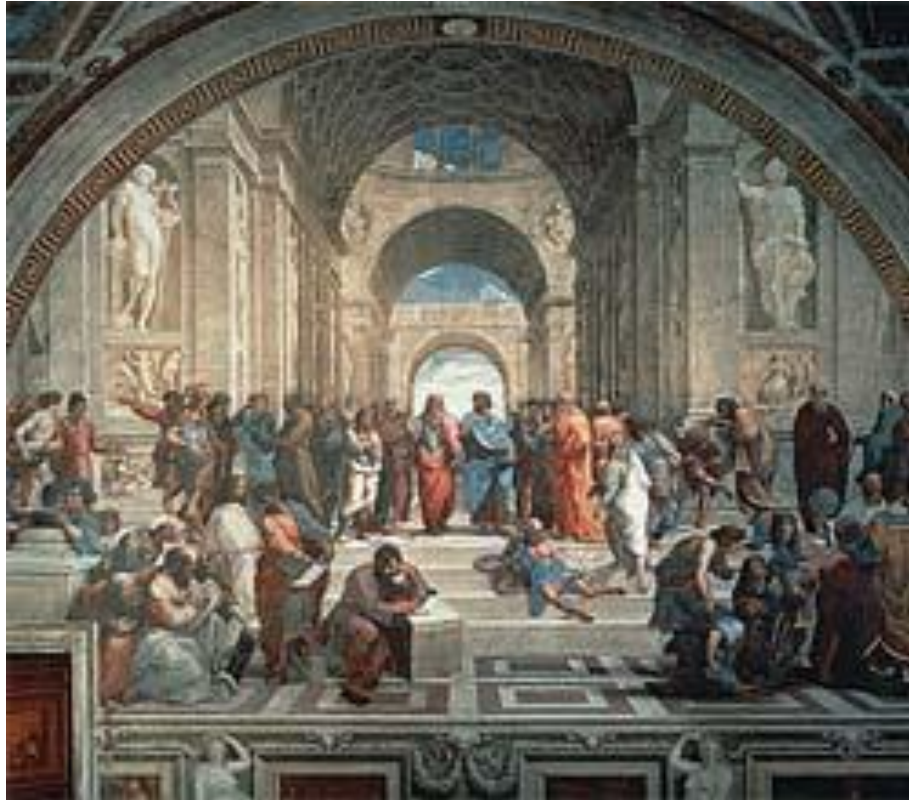
Platão no centro de Escola de Atenas, afresco de Rafael no Vaticano: absorção pela Igreja.