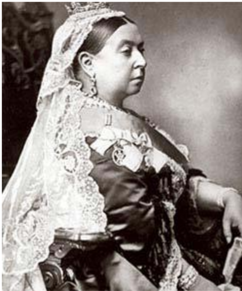
A rainha Vitória: governante de uma época famosa pelo puritanismo.