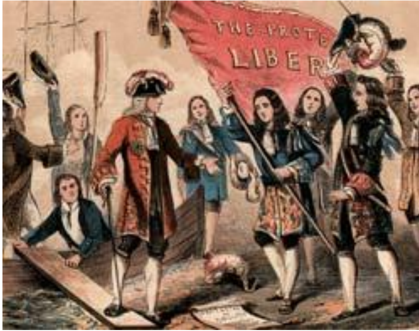
Alegoria do desembarque de Guilherme de Orange na Inglaterra: vitória da burguesia.

A volta de Locke à Inglaterra, em 1688, na comitiva do novo rei, Guilherme de Orange, teve um forte aspecto simbólico. Significou o triunfo das ideias liberais do filósofo a respeito da organização do Estado e a consolidação do poder político da burguesia. Guilherme de Orange desembarcou no país com o propósito de recorrer às armas contra o rei Jaime II, que acabou fugindo para a França. O monarca, católico e impopular, havia atraído o descontentamento da cúpula da Igreja Anglicana, que articulou o retorno do futuro soberano. O episódio, que passou para a história como Revolução Gloriosa, foi na verdade uma transição pacífica, mas significou uma mudança profunda no sistema político, antes baseado no poder absoluto do rei. Assim que assumiu, Guilherme de Orange convocou um Parlamento. A nova casa legislativa publicou uma declaração de direitos, inaugurando a monarquia constitucional, que, atualizada, vigora até hoje no país. A deposição de um rei por descontentamento popular foi ao encontro das ideias que Locke expôs no Segundo Tratado sobre o Governo. Na obra, o filósofo defende que a administração do Estado se sustenta num pacto social entre o rei e o povo, tendo em vista o bem-comum. Se os interesses do povo são contrariados, justifica-se a deposição do monarca. Locke, para relativizar o poder do trono, argumentava que todos os cidadãos têm o direito natural à liberdade e à