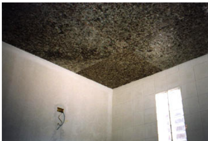
Figura 3. Forro em fibras vegetais (papel acartonado).