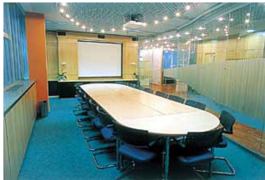
Figura 6. Forro metálico.