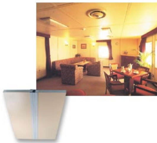
Figura 4. Forro em fibras minerais.