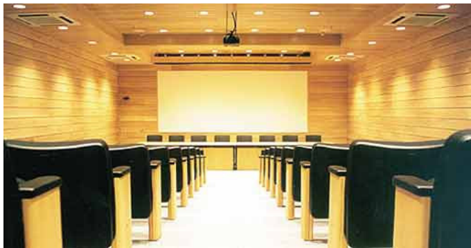
Figura 5. Forro e paredes em madeira.