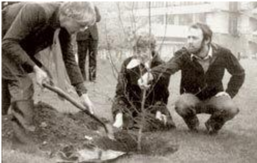
Professores de escola inglesa: o docente como aprendiz permanente